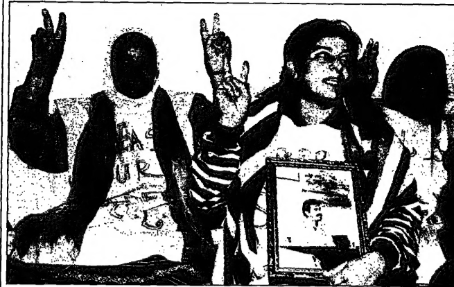
كرميات بشاركن في بيروت بشارب من الطعام مساندة اوجلان